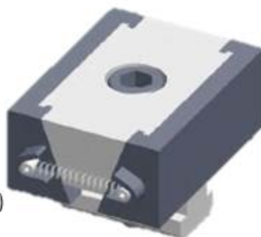
Anwendungsbeispiel: M16.12.1201.03 mit fester Backe M16.1202.03 (Seite 19)