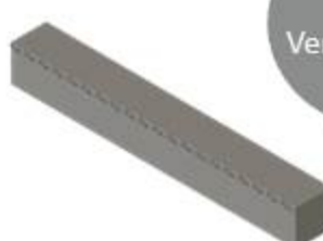
FB10120401 Einschraubbacke mit Krallen