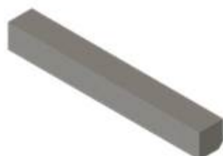
FB10120201 Einschraubbacke glatt