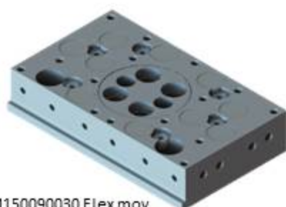
FM150090030 Flex mov im Lieferumfang, wie abgebildet