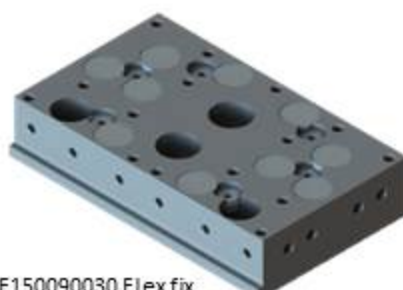
FF150090030 Flex fix im Lieferumfang, wie abgebildet